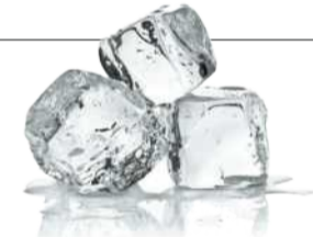
Schocktherapie – wer sich das antut, hofft auf eine Belohnung