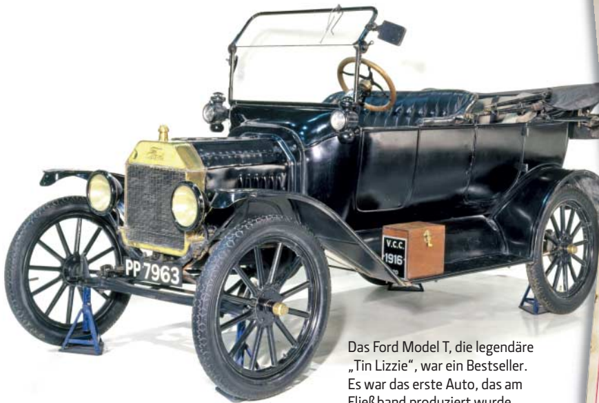
Das Ford Model T, die legendäre „Tin Lizzie“, war ein Bestseller. Es war das erste Auto, das am Fließband produziert wurde (Foto rechts). Henry Ford (oben rechts) konnte dadurch seinen Preis sehr niedrig halten.